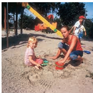
L'installation est prête à l'usage