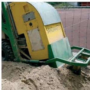
Nettoyage jusqu'à une profondeur de 40 cm