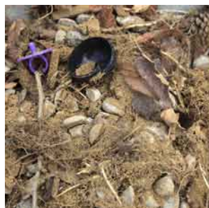
Saletés / déchets*