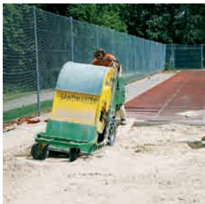
Einfahrt in die Anlage